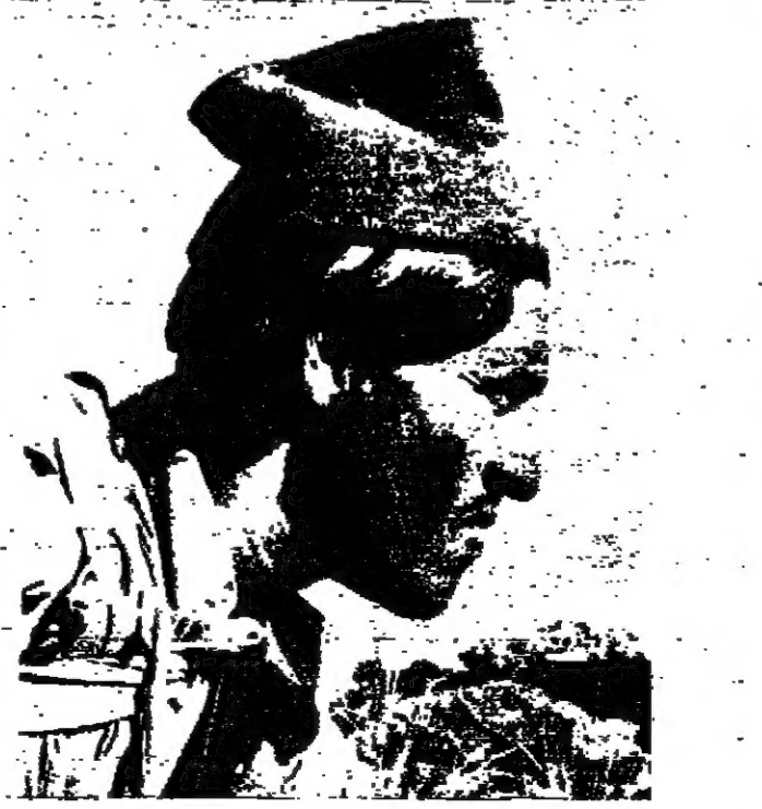
صورة جمال الاستاذ القنوني ، وصورة شاب من قبائل اليبان ... لاحظ التشابه الواضح في التقاطع والاسم المتماثل . هناك من يقول ان اصل اليبان يند من الغرق